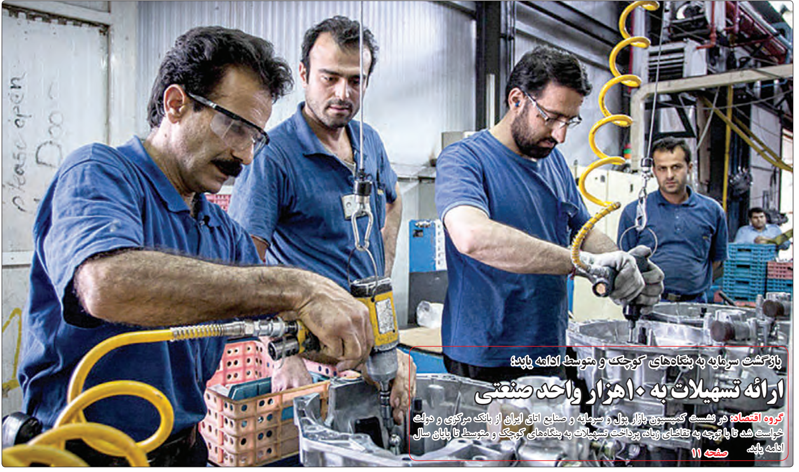
بازگشت سرمایه به پشته‌های کوچک و متوسط اکلانه پاینده