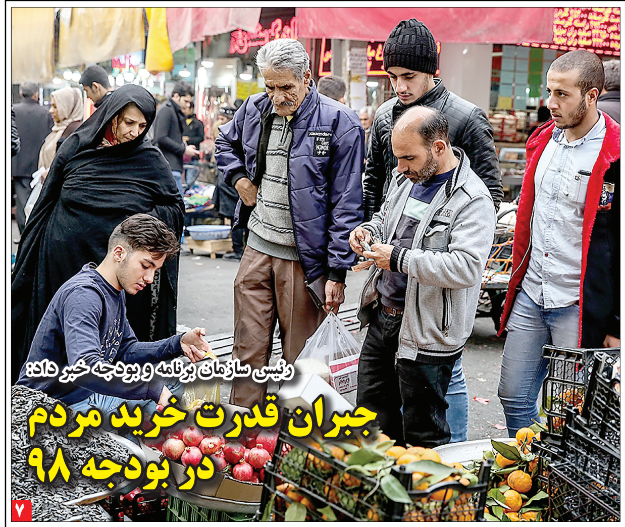
رئیس سازمان برنامه و بودجه خبر داد که جبران قدرت خرید مردم در بودجه ۹۸

به گزارش زمان، تکاپوی مردم برای فروش دلار موجب شده تا قیمت این ارز در خیابان فردوسی با کاهش چشم گیری همراه شود. قیمت دلار که طی روزهای اخیر اوج گرفته بود از صبح دیروز و همزمان با رونمایی از اخبار جدید ارزی بانک مرکزی، سیر نزولی را پیش گرفت و ارزان شد. طبق اعلام دولت، در جلسه سران قوا به رئیس کل بانک مرکزی اختیار لازم برای ورود در بازار ارز داده شده است؛ طبق خبری که از دولت بیرون آمد، بانک مرکزی از طریق بانکها و صرافیهای مجاز در بازار ارز مداخله خواهد کرد و اقدامات لازم برای کنترل نرخ ارز انجام خواهد داد و قیمت مبادله در بازار ارز را نیز به نحو مقتضی اطلاع رسانی خواهد کرد.