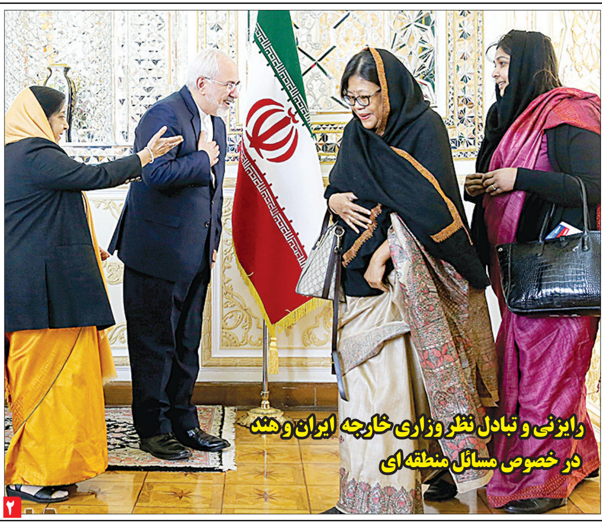
رایزنی و تبادل نظر وزاری خارجه ایران و هند در خصوص مسائل منطقه ای