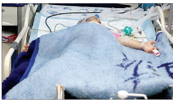
۱۰ آذرماه در بیمارستان فوت کرد. علی فر یادآور شد: در تحقیقات اولیه

مشخص شد که پدر این کودک در گذشته سابقه ضرب و شتم فرزندش را دارد. فرمانده انتظامی گنبدکاووس تصریح کرد: در ادامه نیز این فرد پس از این که با اسناد و مدارک کافی روبرو شود، اعتراف کرد که به علت اعتیاد و فشار اقتصادی کودک را مورد ضرب و شتم قرار داده است. وی خاطرنشان کرد: این فرد برای تکمیل مراحل قانونی تحویل مراجع قضایی شد.