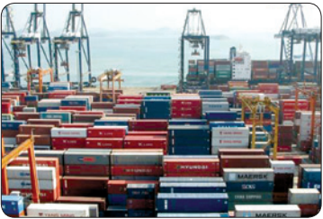
کانتینرهای صادراتی در بندر شهید رجایی، بندر بزرگترین کشور خلیج فارس.

مشاور وزیر راه و شهرسازی با بیان این که ۲۰ میلیارد دلار از منابع کشور به دلیل فروش تراکم و مجوزهای ساخت و ساز در کلان‌شهرها هدر رفته است، گفت: ساخت مسکن‌های گرانبه موجب بلوکه شدن پول‌ها در این بخش شده است.