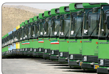
اتوبوسهای سبز رنگ در تهران.