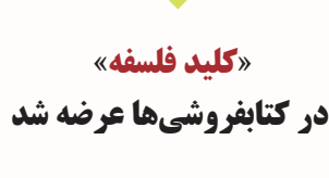
«کلید فلسفه» اثر پروین اعتصامی

عنوان فرعی «از سقراط و افلاطون تا اخلاق و مابعدالمطبیعه» نوشته «پل کلاینمن» با ترجمه محمداسماعیل قلزی، از سوی انتشارات مازیار روانه کتابفروشی‌ها شد. به گزارش مهر اگرچه عده‌ای می‌گویند خواندن فلسفه نوعی اتلاف وقت است، اما در بدترین حالت می‌توان آن را نوعی ورزش فکری دانست که مایه افزایش توان نقد و تحلیل انسان می‌شود. فلسفه مانند هنر محصول فراغت آدمی است. خاستگاه آن حیرت بشر از بودن در این جهان است. اگر هستی را جحشی سیال رهسپار نامتناهی بدانیم، فلسفه تلاش برای حلاجی و کند و کاو در آن است یا به گفته ارسطو علم به موجودات از آن نظر که وجود دارند. مؤلف کتاب «کلید فلسفه» می‌گوید با زبانی ساده مسائل بنیادی فلسفه و دیدگاه‌های بزرگترین اندیشمندان جهان را به ما معرفی کند و در این راه با کاربرد تصاویر و نمودارهای گویا خواننده را به درک و تعمق بیشتر علاقه‌مند می‌سازداین کتاب ۲۳۰ صفحه‌ای در شمارگان ۱۱۰۰ نسخه و با بهای ۱۴ هزار تومان از سوی انتشارات مازیار منتشر شده است.