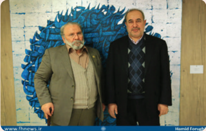
دیدار رییس فرهنگستان هنر با رییس سازمان فرهنگی هنری

در هفتاد و دومین نشست «چهارشنبه هنر» سازمان فرهنگی هنری شهرداری تهران، محمدعلی ممل‌دامغانی، شاعر نام‌آشنا و رییس فرهنگستان هنر جمهوری اسلامی ایران، با محمود صلاحی، رییس سازمان فرهنگی هنری شهرداری تهران، دیدار و گفت‌وگو کرد.