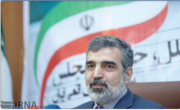
وزیر انرژی اتمی ایران، امیر امیرلو، در نشست خبری

سخنگوی سازمان انرژی اتمی از دستور مساعد رئیس جمهوری برای تامین منابع مالی مورد نیاز دو نیروگاه هسته‌ای جدید خبر داد. بهروز کمالوندی در نشست خبری خود با اعلام این خبر افزود: به امید خدا با تامین منابع مالی به صورت جدی بحث نیروگاه های هسته ای جدید را شروع می کنیم و تاریخی را در آینده ای نزدیک برای کلنگزنی مشخص می کنیم. کمالوندی همچنین در پاسخ به سوال ایرنا درخصوص باظراحی راکتور اراک اظهار داشت: دو هفته قبل، هیاتی از طرف ایران به چین سفر کرده و الاان دو طرف در حال مذاکره هستند. وی با بیان اینکه طرف چینی تحت عنوان Caea شرکتی است که به فعالیت های هسته ای چین نظارت دارد ، از معاهده پیش نویس قراردادهای باظراحی راکتور اراک خبر داد و گفت: این قراردادها همانند قراردادهای چپ (در سطح نازل) نیست که کارفرما و بیمانکار وجود داشته باشد بلکه های خواسته های متعدد و متنوعی وجود دارد که نیاز به مذاکرات مختلف دارد. کمالوندی با بیان اینکه پیش نویس قراردادهای متناسب با خواسته های ما تهیه شده است اظهار داشت: در ارتباط با طراحی کار معطل نشده و به سرعت جلو می رود و طراحی توسط مهندسين ما انجام می شود. وی خاطر نشان کرد: مذاکرات امری زمانبر هست و بعضا می تواند همزمان با آن، کارهای عملی و طراحی شروع شود. کمالوندی درخصوص نحوه همکاری اروپایی ها اظهار داشت: در بخش تامین تجهیزات، علاوه بر چینی ها کمک بقیه کشورها را هم خواهیم داشت داشت. عمده این واحدها در منطقه آسیا و ۷۰ درصد آنها در کشور چین متمرکز شده است. کمالوندی همچنین گفت: آژانس با ۱۸۲ کشور قرارداد پادمانی و ۱۲۸ کشور قرارداد پروتکلی دارد.