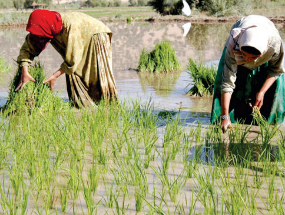
شالیکاران در حال کاشت شالی در رودخانه ارس، اردستان