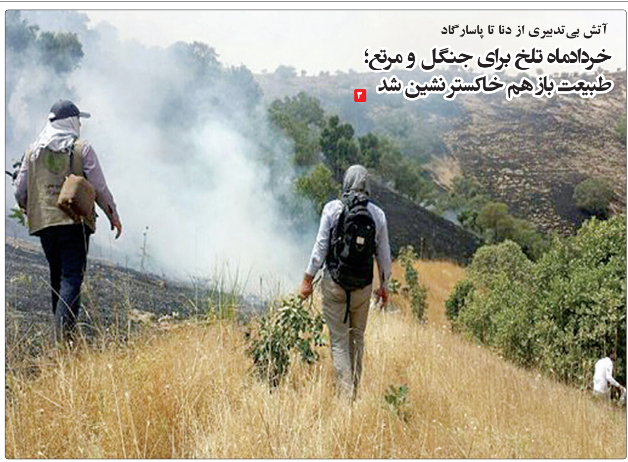
آتش بی‌تدبیری از دنا تا پاسارگاد خردادماه تلخ برای جنگل و مرتع؛ طبیعت باز هم خاکستر نشین شد