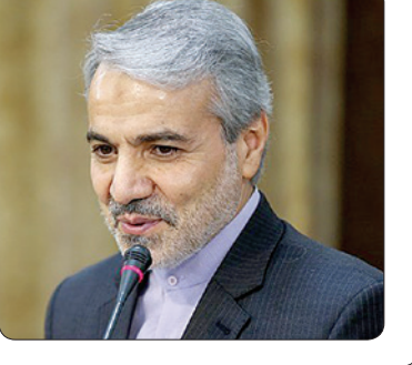
ادامه در صفحه ۲

تومان پرداخت می‌شود و علاوه بر آن یک سبد غذایی به خانواده‌های تحت پوشش می‌دهیم. وی افزود: به دستور رئیس جمهور برای تسریع در پرداخت یارانه غیرنقدی به خانواده‌های نیازمند به مناسبت ماه رمضان این رقم ۱۶۰ میلیارد تومان در اختیار وزارت تعاون قرار گرفت و علاوه بر آنکه رقم اختصاص یافته برای حمایت از خانواده‌های تحت پوشش افزایش یافته است، هیچکس از دریافت این نوع یارانه حذف نشده است.