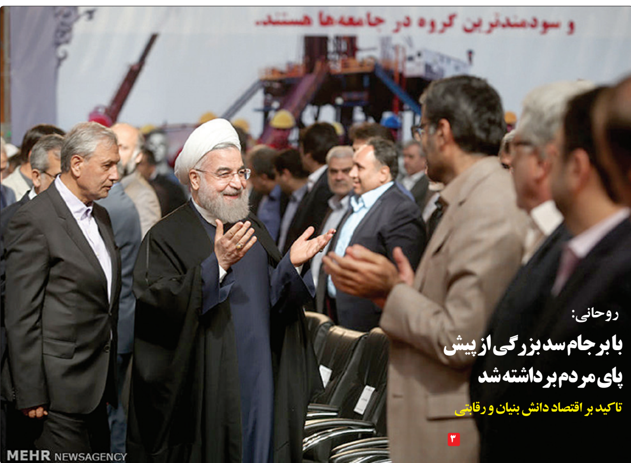
رئیس‌جمهور و سیدبزرگ‌ترین گروه در جامعه‌ها هستند.

در این دیدار آقای رمضان عبدا... نیز با ارایه گزارشی از اوضاع داخلی فلسطین، آخرین وضعیت منطقه و جایگاه ایران را در حل بحران‌های منطقه‌ای مورد تأکید قرار داد.